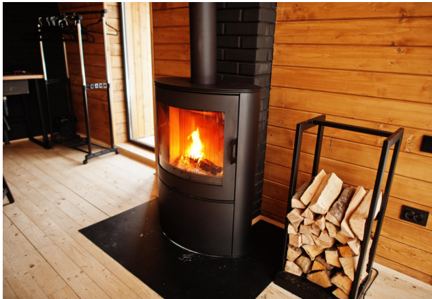
Une chaleur très agréable.

Le poêle à bois ou à pellets séduit les Belges pour plusieurs raisons. Une enquête révèle que 57,7% des utilisateurs apprécient avant tout sa chaleur agréable, tandis que 46,6% soulignent l'atmosphère conviviale qu'il crée dans leur intérieur. De plus, ce mode de chauffage offre une indépendance énergétique (31,5%), un meilleur contrôle des dépenses (26,1%) et repose sur des combustibles abordables (24%).